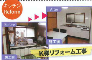
キッチンリフォームをさせて頂きました。