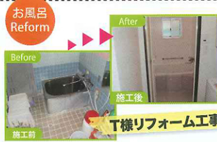
お風呂のリフォームをさせて頂きました。