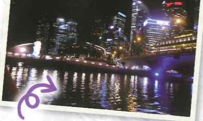
マリーナベイエリア。昼は空から視察、夜は川から視察でどちらも感動的でした。