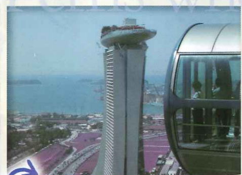
総勢25名乗りの世界最大の観覧車。シンガポールの綺麗な景色が一望でき、一周30分ほどの間、オーナー様全員で乗る事が出来ました。