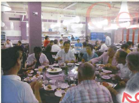
夕食はマレー料理のレッドチリクラブや中華料理などを美味しく頂きました。お酒もすすみ、会話も弾みます！