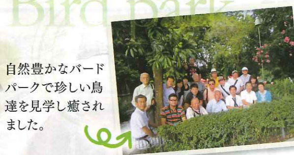
自然豊かなバードパークで珍しい鳥達を見学し癒されました。