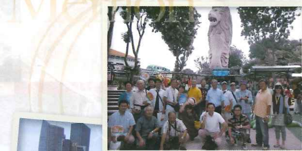
シンガポールと言えばこれ！ 高さ20mを超えるマライオンに一同ビックリ！