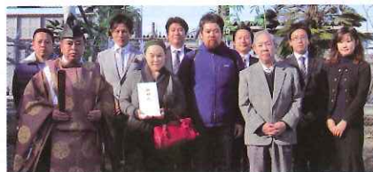
Haco+ Y様邸 桐生市

12月12日、風がなくていい天気に恵まれ、無事に地鎮祭が行うことができました。先日お子様が生まれました。おめでとうございます!お施主様の期待に沿えるよう、気を引き締めて頑張っていきます。