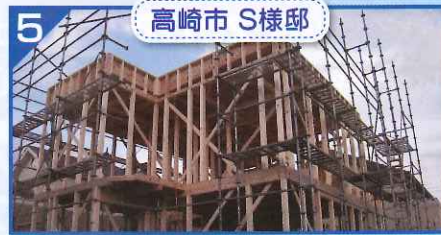
5 高崎市 S様邸

7棟の賃貸住宅の現場もだいぶ景色が変わってきました。名称も「エムロード」に決定し、春の完成に向けてたっぴま入居募集中です。見学会もしていますので、是非お越しください!