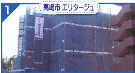
1 高崎市 エリタージュ