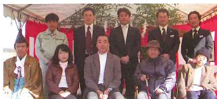
ファミリCHINTAIハウス N様 高崎市

大安の12月6日に地鎮祭を執り行いました。お施主様はユー・ミー・マンションに引き続き、戸建て賃貸6棟の建設をご命頂きました。社員一同、御礼申し上げます。立派な戸建て賃貸住宅を作っております。