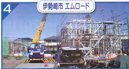
4 伊勢崎市 エムロード

戸建賃貸3棟の現場です。完成すれば全部で7棟になります。順調な進捗が確認されているのも、弊社の賃貸事業を信頼されているお施主様と入居者の方々のおかげです!