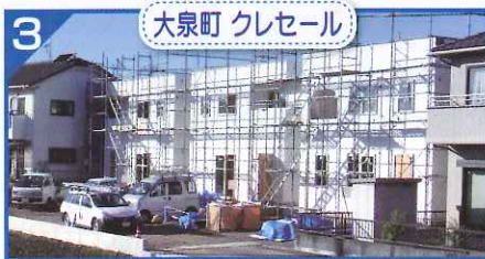
3 大泉町 クレセール