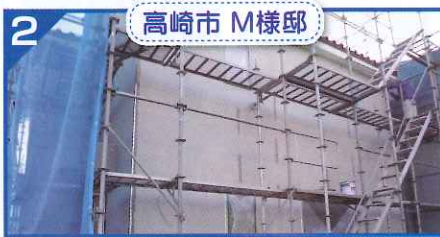
2 高崎市 M様邸

5階までコンクリートの打設が終わり、上棟しました。1月からは室内の工事も本格的に始まります。2月末にはモデルルームが完成予定です。ご期待ください。