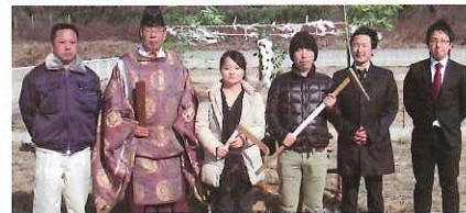
Haco+ T様邸 高崎市

1月9日、大安に地鎮祭が行われました。お施主様のお子様も祭りに参加をいただき、お宅に対する深い思い入れを感じました。お施主様の思いに答えられるよう、社員一丸となって頑張ります。